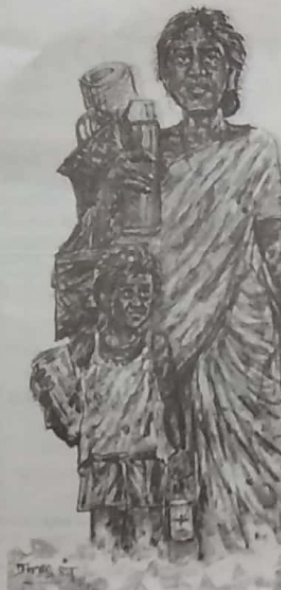
சுமையான குழந்தைகளைக் கொண்டு வரும் பெண்கள்

சுமையான குழந்தைகளைக் கொண்டு வரும் பெண்கள்... (Text describing the illustration)