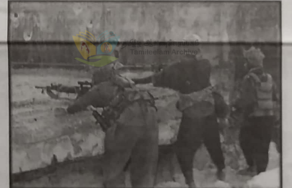
கண், மண்ணைக்கட்டி சிறந்த தளபதியால் இவன் போது தளக்கு விட்டிருக்கின்றார். அடுத்துரை யின இவனது திறமைகளைக் காட்டி தளக்கு விட்டிருக்கிறார். இவ்வாறு இவன் திறமைகளைக் காட்டி தளக்கு விட்டிருக்கிறார்.

இவன் பரிசீசி முயலில் திறமையாக பரிசீசி செய்து கொள்ளுமணி மத்தியில் நம்நியாள் திராமச்சேரி நம்பிக்கையில் செல்வப்படுதல்வணியம் மறத்தமிழ் மகனாய் முத்தங்கன் வினையும் பூமி முருங்கனில் ஈனேத் திரம் என்னும் பெருகுடன் இம் மண்ணில் உதித்தான். இவன் மிகவும் வயிசு குழிப் பத்தில் பிறந்தும் இவனது தந்தை இவரின் ஆரம்பக்கல்வினை மண்ணை முருங்கன் மகாவித்தியாலயத்தில் பரிந்துவித்தார். இவன் ஆசிரியர்கள் மத்தியில் நற்பெருகு டுள்ள திறமையானவனாகவும் செயற்பட்டு வந்தான். இவனது திறமைகளைக் கண்டு ஆசிரியர்கள் இவனை மகாவித்தியாலயத்தின் மண்ணைத் தரைவணக்க தியதித்தனர்.