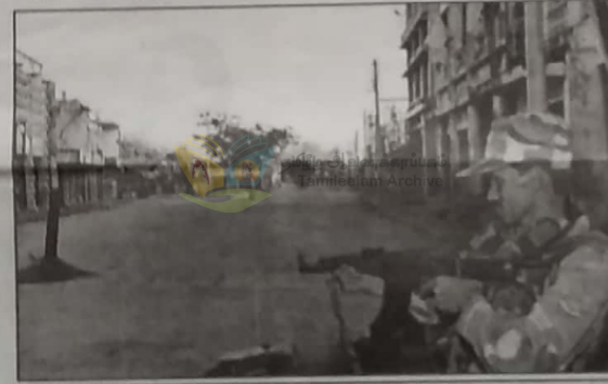
இந்த ஒத்தையுடைய இயக்கம், தமிழீழப் பகுதி தழுவிய ஓர் செயலகமாக உருவாகும். சிவில் நிர்வாகம் என்ற பெயரில் தாம் நடத்தும் இராணுவ நிர்வாகம் செயலிழந்து போகும். பிராந்தியங்களின் கையகப்படுத்தி வைத்திருக்கும் தமது அங்குமிங்குமிடங்களும் கோவில்களும் முடிவடையும் என, சிங்கள அரசு நிர்வாகம் அச்சம் கொண்டுள்ளது.