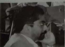
பார்வையாளர் பகுதியில் அமர்ந்திருக்கும் சிங்களகாலீன் இயக்கவாழ்க்கான உயர்நீதிமன்றத்தினர்

சிங்களத் தேச இனம் தமிழ்த் தேசஇனத்தைப் பிரதிநிதித்துவப்படுத்தும் தமிழீழ விடுதலைப் புலிகளுடன் பேச்சுவார்த்தை நடாத்துவதின் மூலம் ஏற்படக்கூடிய நியாயமான ஏற்புடைய